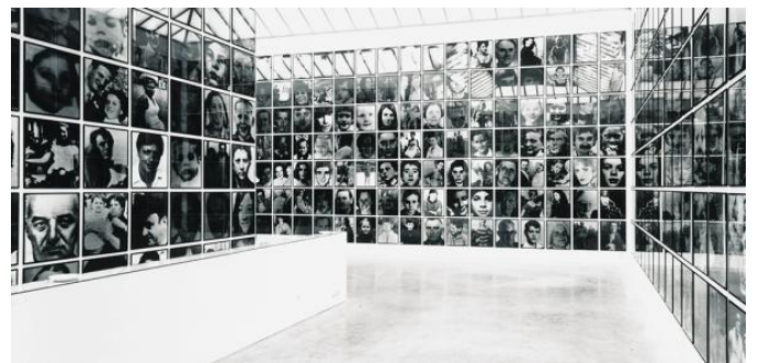
图10 《档案》，克里斯蒂安·波尔斯坦斯基（Christian Boltanski）摄影/装置，1987年。

法国视觉艺术家克里斯蒂安·波尔斯坦基（Christian Boltanski）大量使用匿名肖像、旧照片与档案图像，通过重复、陈列与光影装置，使影像脱离个人叙事。他想要说明，图像本身的清晰度不能还原观看者的感知力，只有承载思想的精神力量才能解释并激发记忆媒介的社会能量。