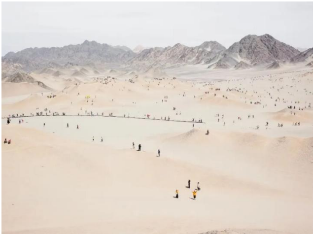
图7 《在黑独山游玩的人》，张克纯，2025

动。博伊斯试图将艺术的视觉经验从技术中解放出来，使其回归到自然源发的根本条件上，艺术家感知、引导并开启自然中的能量。张克纯作品集《北流活活》虽然常被归类于“景观摄影” 3 范畴，但其创作并不沿袭西方“景观摄影”的观看逻辑。他沿着黄河拍摄，将宏大的自然地貌与人类活动遗留下的痕迹——如巨型雕塑、工地与人工设施——并置于同一画面之中，用镜头进行“社会雕塑”。