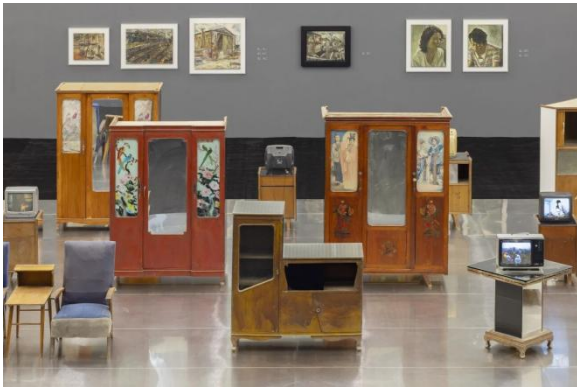
图5 “杨福东：香河”展览现场图，UCCA 尤伦斯当代艺术中心，2025。

中国当代摄影看似带有某种怀旧视觉倾向，但其关注的重点是在纷繁万象中重新触及人的灵魂，不再停留于视网膜层面的观看。某种意义上，当代摄影也在催促我们重返自身，建立身心合一的感知流动。它以超感官的方式层层显现世界，人人皆可能进入这一审美感知结构之中，人人得以在持续的感受中重新理解光、热与能量，提升为体验完整的生命存在方式。如今技术的复杂使人们不再对元素有感觉，例如铁匠对火的元素不再有感觉。从整体上理解这种力的态势和我们在这个时代所面临的能量问题——不断去感受，什么是真正的光，什么是真正的光。博伊斯结合质料理解其精神，将人提升到