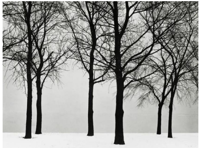
图6 《芝加哥（雪中的树）》，哈里·卡勒汉（Harry Callahan），1950年

就博伊斯对物质精神的探索而言，主体的情感结构来自其所处的自然结构与社会结构中，尤其是地理位置、空间环境和自然风土对个体感知能力的塑造。摄影家无法像画家那样自由调度材料，那么身体在场就显得尤为重要。对美国摄影师哈利·卡莱汉（Harry Callahan）而言，最重要、最有意义且真实的是他与拍摄对象的互动，他在拍摄杂草、记录霓虹灯标志时做出的优雅姿态。摄影行为并非作品本身，而是过程，以及他与被摄对象之间身体与情感上的深度融入，成为他主要的关注点和最大的乐趣。他对摄影构建自身世界的力量的新信仰，使他感到解放、陶醉并获得了极大的满足。