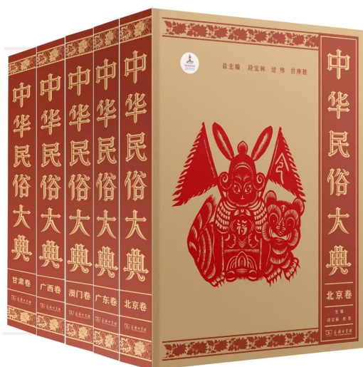
图 1 《中华民俗大典》商务印书馆 2024 年 9 月出版

中国在历史上很早就有民间文化采集制度，对民间文化的调查采写以及编印出版具有很好的传统，尤其是进入 21 世纪以来从国家到各地方非物质文化遗产保护政策的实施，对民间文化的传承与发展起到了积极的促进作用。对中华民俗文化的调查、编写、出版是专业性很强的一项重大的文化工程。20 世纪 90 年代启动的《中华民俗大典》（见图 1）项目由中国民俗学会和中国民间文艺家协会共同主办。作为国家出版基金项目 and “十四五”国家重点图书出版规划项目，首期编印出版的北京卷、澳门卷、广东卷、广西卷、甘肃卷等 5 卷于 2024 年 9 月由商务印书馆出版。这是民俗文化界和出版界一件可喜可赞的盛事，对民间文化的主体性建构和增进中华文化认同具有重要而深远的意义。