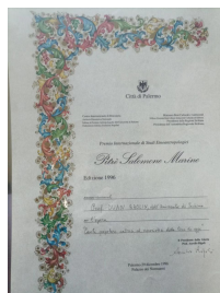
《中国民间文学概要》1996 年获意大利巴勒莫人类学国际中心的大奖——“彼得奖”